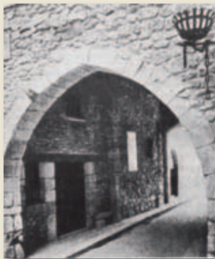
'Portal del Romeu', arco de Tortosa donde arrancó la obra sacerdotal de mosén Sol

- Quiero ser sacerdote. Estudió la carrera en el seminario de Tortosa y obtuvo luego el doctorado de teología en la facultad pontificia de Valencia. Fervoroso amante de la Virgen María , se atrevió, a punto de cumplir sus veinte años, a presentarle un "reto" a la Señora, pidiéndole amparo y protección hasta la muerte: - Si tal no hicieras, Virgen María, tendré derecho a quejarme de ti, y a dar por borrada de la historia aquella famosa sentencia según la cual nadie que haya implorado tu amparo e invocado tu protección ha sido jamás abandonado. A la hora de cantar misa era hombre de una pieza: alto, robusto, agradables maneras, con aire de bondad juvenil y de honradez. Se le daba muy bien la catequesis, el trato con chicos y chicas. Le ordenaron sacerdote a sus 24 años, junio de 1860. Tomó en serio su tarea: - Siendo tan alta, tan sublime, la dignidad de sacerdote, resuelto no rebajarla... Quiso ser un cura "disponible", sin ataduras, libre de espíritu y de compromisos, para trabajar donde fuera necesario. Trabajó, Dios bendito, cuánto trabajó: los jóvenes, las parroquias, las monjas de clausura, los pobres, la predicación, el periodismo, las misiones populares; sin alboroto, sin prisas, llegaba a todas partes, dejando siempre un rastro