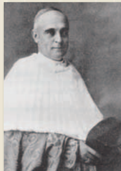
El cardenal Merry del Val, gran apoyo en la fundación del Colegio Español de Roma