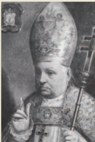
El cardenal de Toledo Antolín Monescillo († 1897)

Toledo hubiera ganado muchísimo retirado a tiempo su cardenal Monescillo, por cierto, figura insigne de la Iglesia española durante los cincuenta años anteriores: teólogo, periodista, orador, diputado en Cortes, polemista, obispo del Concilio Vaticano I, amigo de escritores,